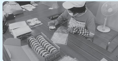
車用配線コード袋入れ

作業の中には難しい作業もありますが、利用者ひとり一人が自分の役割をしっかりと理解し、間違わないように一生懸命頑張っています。