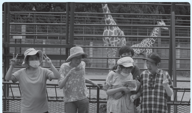
キリンとの記念写真

7月の午前中の涼しい時間帯に、少人数(5人程度)で感染対策をして姫路市立動物園に外出しました。利用者にとっては約10年ぶりの動物園見学で、「キリンの首が長い、ウサギがかわいい」など、近くまで寄ってくる動物を見て歓声を上げておられました。また休憩所で、利用者の希望するジュース・アイスクリームなどを食し「おいしい」と言って満足されていました。