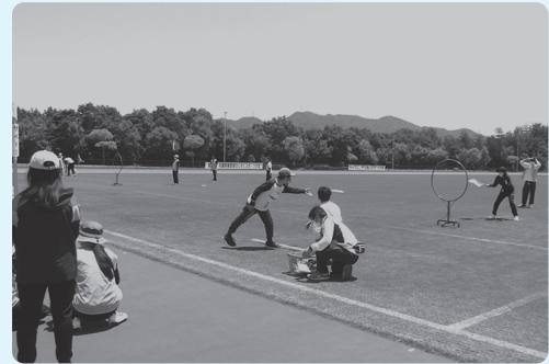
フライングディスク競技

当日は練習の成果を発揮し、金メダル1個・銀メダル2個という好成績を収める事が出来ました。