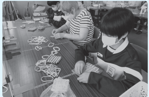
くつ下のはぎれを使ってコースター作成中

今回のトライやるウィークの経験が、今後の夢を考える第一歩になる事を願っています。