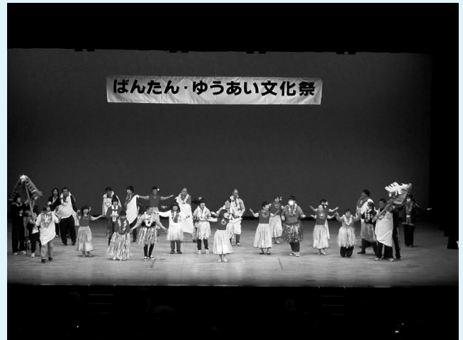
▲いちかわ園 フラダンス