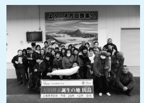
▲万田発酵工場にて

12月8日(金)～9日(土)にかけて保護者の方と一緒に四国方面へ外泊旅行に出かけました。初日の金刀比羅宮付近の散策では少しみぞれが降る中でしたが785段の階段を上って参拝に行かれる方、お土産屋めぐりをされる方、自由散策で過ごされました。宿泊は道後温泉で、バイキング料理に舌鼓を打ちながらほとんどの方がたくさんの品数を食べられていました。二日目は、伝統的な今治タオル、万田発酵の見学に行ってきました。二日間とても寒い気候でしたが楽しい旅行となりました。