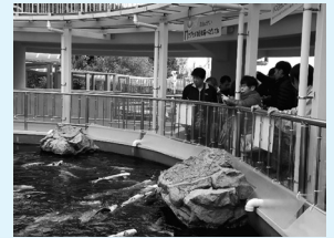
▲姫路市立姫路水族館（生活介護）