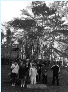
▲龍野公園（就職継続B型）

11月27日(月)に就労継続支援B型事業の利用者が、龍野公園へ紅葉を見に行きました。もみじ等たくさんの木が色鮮やかに紅葉していました。昼食は『日山ごはん』にて色どりのよい美味しい食事を堪能しました。日々忙しく働いている利用者にとっては、このゆったりとした一時が、栄養補給になり、又明日からの就労意欲がより一層高まる行事となりました。