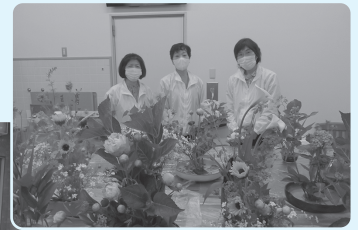
市川町民生委員児童委員協議会による「花の施設訪問」