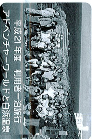
平成21年度 利用者一泊旅行 アパンチヤワールドと白浜温泉 平成21年12月3日～4日